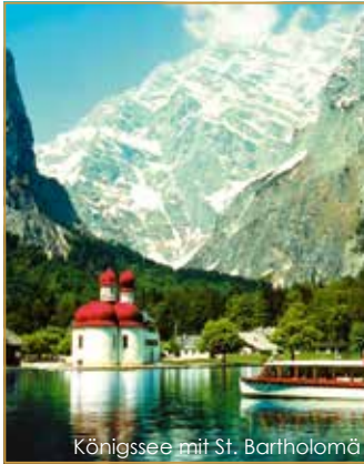
Königssee mit St. Bartholomä

Dann wird Ihnen ein hohes Maß an persönlicher Einsatzbereitschaft abverlangt und es ist höchste Zeit für einen Erholungsurlaub.