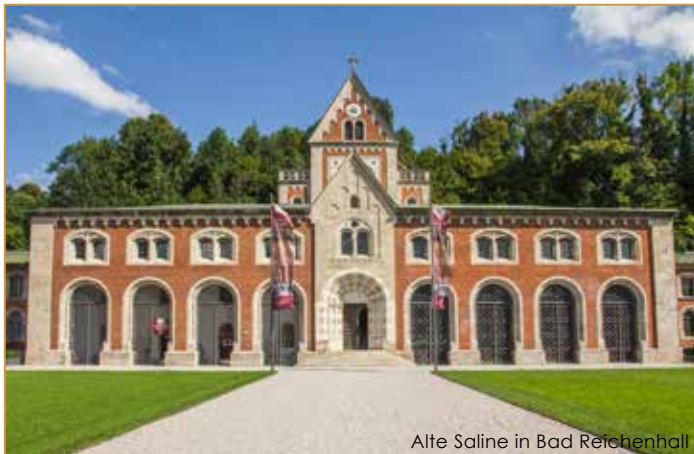
Alte Saline in Bad Reichenhall

Auch von den Kassen und selbst vom Finanzamt können finanzielle Hilfen bzw. Vorteile geltend gemacht werden.